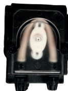
Pompe régulation pH